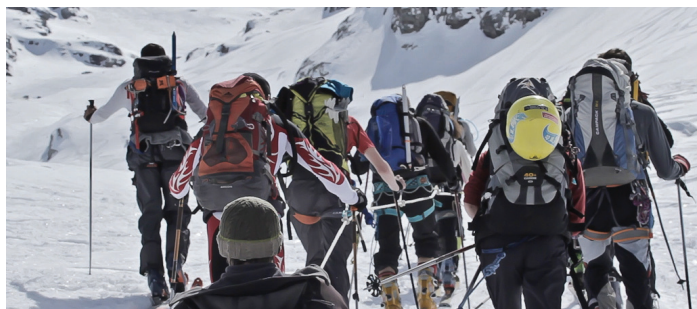
« Nat and Co »