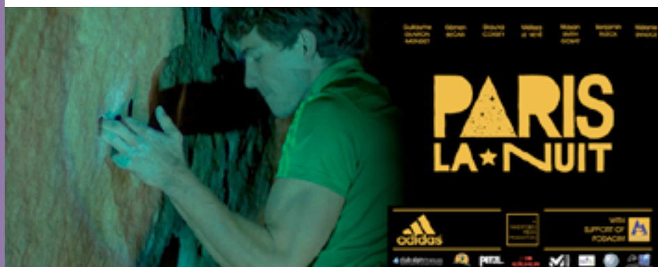
L'affiche de Paris la nuit, de Clément Perotti, promotion 2014

En 2015, le FODACIM soutiendra une dizaine de projets de film. Date limite de dépôt des dossiers : 29 mars 2015. Précisions et formulaire à télécharger sur le site www.fodacim.fr , rubrique « Envoyez votre projet de film ».