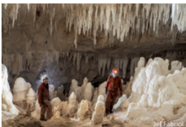
Wara Kalap, de Mathieu Rivoire, 2014

➤ Découvrez le nouveau clip de présentation du FODACIM sur notre site www.fodacim.fr